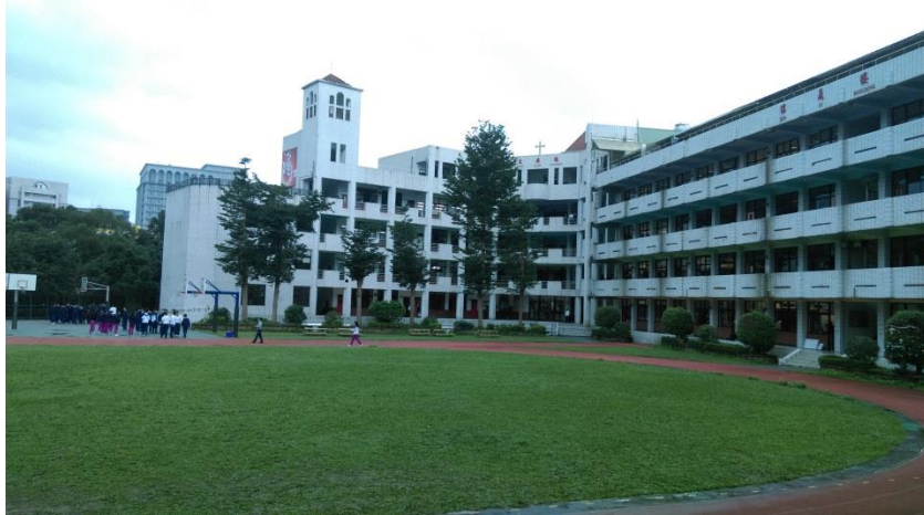
圖(一)飛行競賽場地