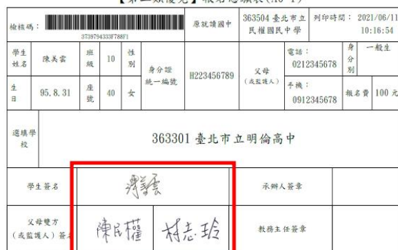
【第二類優免】報名志願表(A0-1)

1. 上述資料請用藍色或黑色原子筆填寫, 以免發生掃描無法讀取之情況。 2. 報名志願表(A0-1)不得有任何塗改, 學生簽名及家長簽名不可使用鉛筆, 不可只簽單姓(或單字)。 3. 報名志願表(A0-1)不得有任何塗改, 學生簽名及家長簽名不可使用鉛筆, 不可只簽單姓(或單字)。