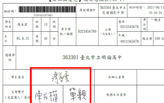
【第二類優免】報名志願表(A0-1)